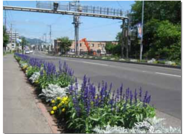
国道沿いに花がきれいに咲きそろいました

平成 21 年 7 月 17 日、札幌市南区常盤の「芸術の森フラワーロードに花を咲かせる会」の活動状況取材させていただきました。当会は「自分たちの足元は自分たちできれいに。出来るときに出来ることを」を活動コンセプトとして、国道 453 号沿いの両側歩道 5.64km に毎年約 13,000 株あまりの植花活動を続けております。活動を開始してから今年で 9 年目になりますが、その間、 水やりなどの管理の手間を少なくする方法 や、 見た目がきれいで手間が掛らない花の組み合わせ などの創意工夫をされています。街路花壇の取り組みをされているところでは同じような苦労があると思いますので、是非参考にさせていただきたいと思います。